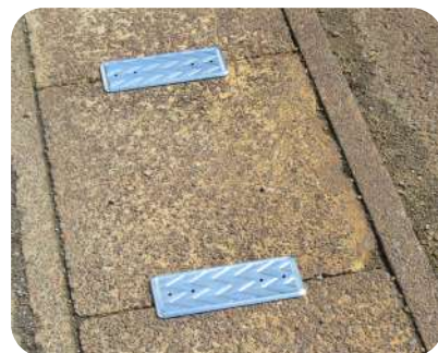
実際に設置した写真です。