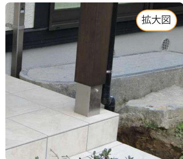
実際にポーチの独立柱に設置されている写真です。